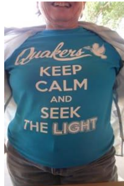
Mantén la calma y busca la Luz

William Penn, Some Fruits of Solitude (Algunos frutos de la soledad), 1693.