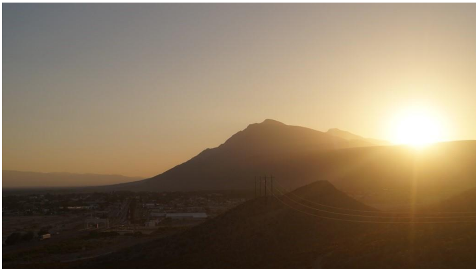
Cuatro Ciénegas, Coahuila

Hay que recordar que John Woolman vivió en una época muy diferente a la nuestra. En aquel entonces, el comercio de esclavos era clave en la economía de los imperios, la falta de justicia social y la forma en la que se desarrollaba la sociedad aún no podían ver lo inmoral de la privación de la libertad de otro ser humano. Quizás por ello, Woolman muy tempranamente descubrió en su interior la convicción de luchar contra la esclavitud, considerándola sinónimo de muerte en vida. Así en 1754 publicó un ensayo titulado “Algunas consideraciones sobre la tenencia de negros” en el que se describe lo siguiente: “Suponer que es correcto que un hombre inocente sea excluido en este día de las reglas comunes de la justicia; que se le prive de esa libertad, que es el derecho natural de las criaturas humanas; y que sea esclavo de los demás durante la vida... es una suposición demasiado burda para ser por esto: que los que injustamente privaron a los hombres de ella, debían ser castigados de la misma manera como si los hubieran asesinado. El que roba un hombre y lo vende, o si se encuentra en su mano, será seguramente condenado a muerte. Esta parte de la ley era tan importante que Pablo... añade esto, fue hecha para los ladrones de hombres (como se describe en I Timoteo 1:10).”