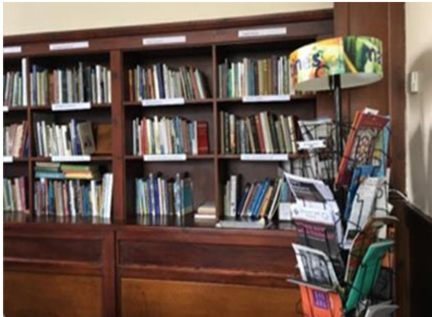
Libros en la casa de la Junta de Kendal, Gran Bretaña

Alrededor de 2004 tuve el privilegio de colaborar en la revisión de la traducción del inglés al español de Fe y práctica de la Junta Anual del Pacífico. Aprendí mucho al leer todo el libro en corto tiempo y en forma metódica y meticulosa. Mi primera impresión fue que era un libro de mucha profundidad espiritual, una madurez social y humana que no había visto antes en un grupo religioso, un constante respeto para la libertad de pensamiento y elección del lector, un tono amoroso y bondadoso constante. En fin, ¡me fascinó! Coincido con lo que está escrito al inicio en la Nota del Traductor: “nuestra admiración y agradecimiento por la obra monumental cuya elaboración tomó 10 años de intenso trabajo corporativo.”