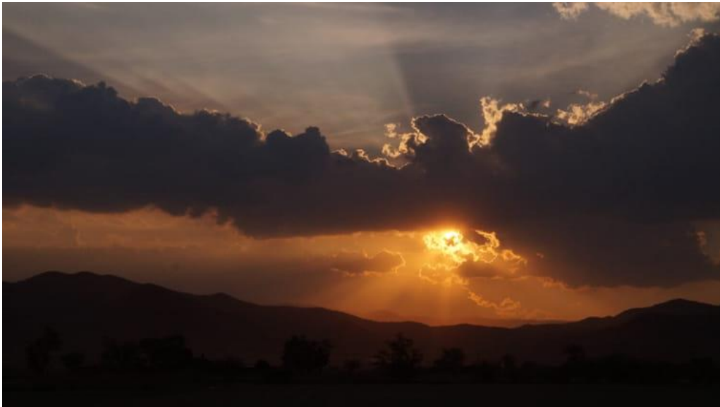
Atardecer en mi pueblo, Oaxaca

Cuando empecé a asistir a las reuniones de la Junta Mensual de la Ciudad de México hace un tiempo, me encontraba en un profundo dilema sobre la relación que tuve en el pasado con el dogma religioso en el cual crecí. De alguna manera me enseñaron a vivir apegado a los pasajes bíblicos y no existían la voluntad y las condiciones para preguntar cosas como: ¿Por qué creíamos y vivíamos de acuerdo a lo que un grupo de hombres escribió hace cientos y miles de años? ¿Por qué eran sagradas las escrituras? ¿Por qué era la palabra de Dios? ¿Quién les daba esa autoridad a aquellos hombres para hablar en nombre de Él? Supongo que eso me hacía tener preguntas al inicio de los primeros encuentros con los amigos de la Junta de la Ciudad de México y, con el tiempo, muchas de esas dudas fueron despejándose.