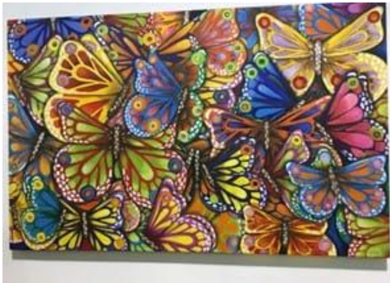
Pintura en exhibición en aeropuerto de Huatulco

La Reunión de Adoración Dominical tiene una duración de una hora (11-12hs, hora de la Ciudad de México) y la de Entre Semana (los miércoles), de media hora (19-19:30hs). Seguidas ambas de un tiempo de convivencia.