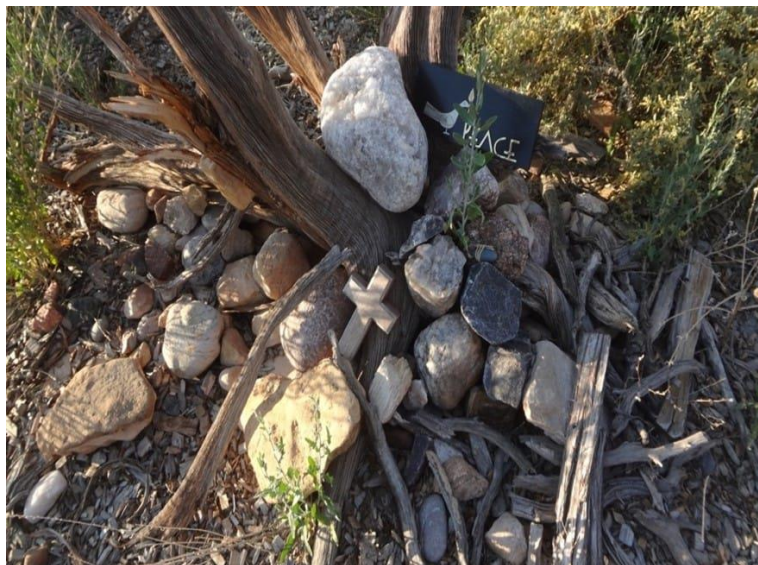
Ghost Ranch, Abiquiu, Nuevo Mexico

Nueve personas, entre ellas seis cuáqueros, fueron arrestadas mientras protestaban sentadas en silencio frente a la Feria de Armas DSEI en el este de Londres ayer, 8 de septiembre. Camiones cargados de equipo militar que llegaban al Centro ExCel fueron rechazados cuando alrededor de 100 cuáqueros y otras personas se reunieron y cantaron en la carretera y en el césped, a pesar de una gran presencia policial.