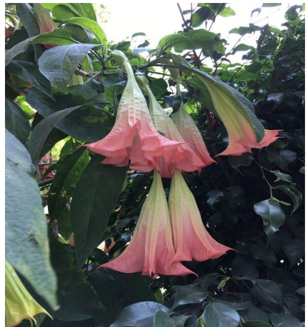
Flores en jardines de Iglesia de San Jacinto, San Angel

Y comienza la temporada de dejar ir, cuando la Madre Naturaleza nos muestra a todos cómo se hace. Déjalo ir, libérate, quítatelo de encima, déjalo caer, da paso a lo nuevo. Crea espacio para nuevos pensamientos, nuevas ideas, nuevas aventuras y nuevas conexiones, al deshacerte del peso muerto que has estado cargando por tanto tiempo. Y mientras estés allí, renaciendo y renovándote, deja ir también las viejas ansiedades. Deja ir cualquier duda, miedos o creencias, que ya no te sirven. Libera las amarguras o heridas del pasado que se deleitan en tu belleza. Sé valiente, no temas la desnudez mientras tus hojas se te escapan. La madre naturaleza no teme, mira y aprende.