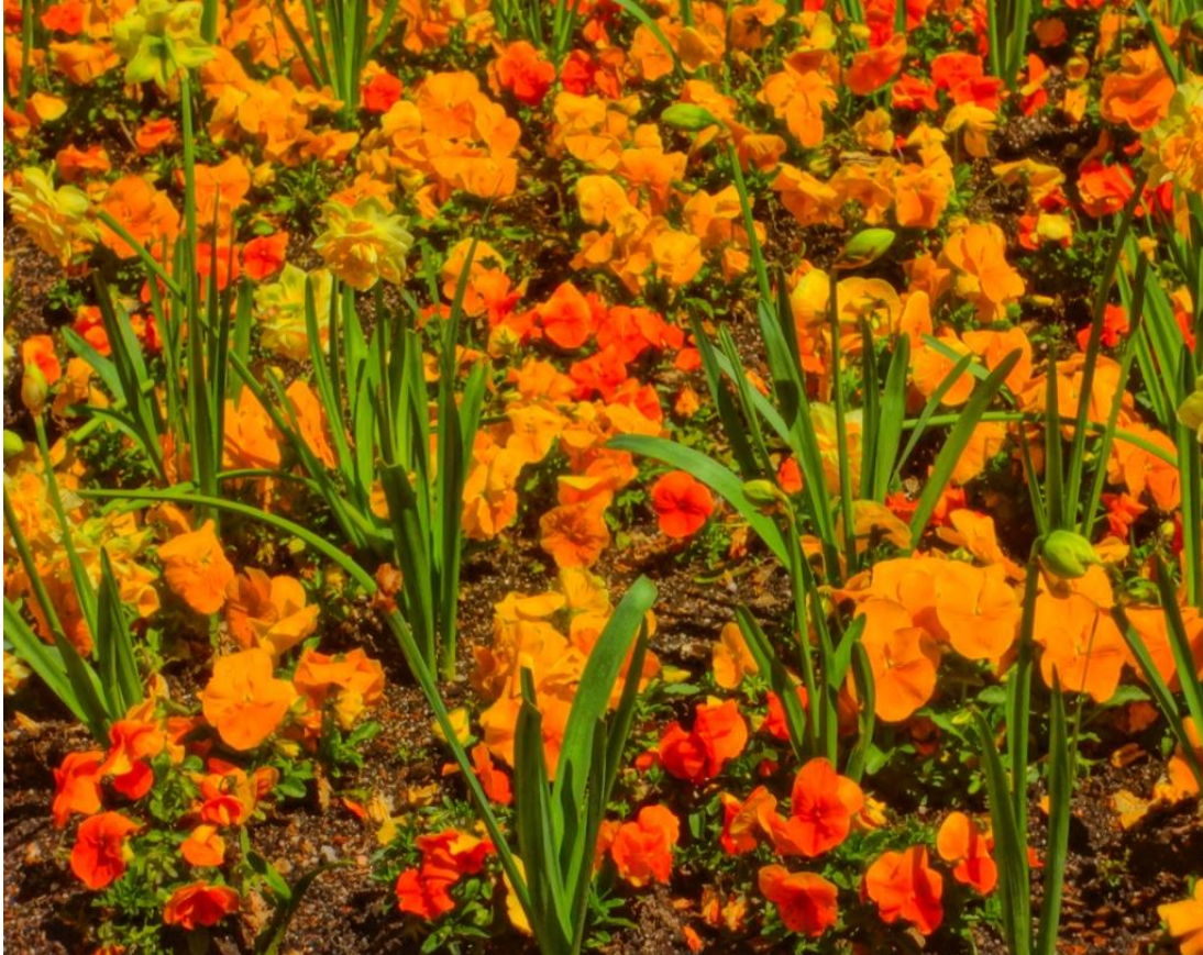
Flores en la Plaza Mayor, Madrid