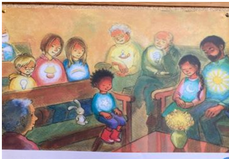
La Luz interior en todos

No sugiero que los Amigos hagamos proselitismo para captar a más personas, tan solo quiero hacer hincapié en que debemos estar dispuestos a recibir a aquellos que lleguen a tocar nuestra puerta y recibirlos del modo que lo hacemos con los Amigos más allegados. Y en este momento, quiero lanzar una nueva pregunta: ¿de qué manera nos conmueve la Luz al ser expresada de formas distintas? Lo pregunto porque de nada sirve que celebremos la diversidad dentro del cuaquerismo si dentro de cada uno, en nuestro interior, seguimos siendo un individuo de un grupo homogéneo. Aquí lo único que quiero agregar es que no debemos tampoco olvidarnos de que la Luz no vive sólo en el interior de cada uno de nosotros, sino que lo hace, de manera magistral, en nuestra comunidad. La Luz habla al que espera, pero no le corresponde al destinatario escoger el mensaje. Algunas veces la Luz nos revela un mensaje para la vida privada, pero otras veces nos usará como medio para comunicarlo a alguien más. Al final, nosotros somos tanto la persona que vemos en el espejo como la persona que se refleja en los ojos del prójimo. Sepamos, pues, recordar a los demás Amigos e interesarnos por aprender de ellos para estar listos cuando la Luz se auxilie de nosotros para reflejarlos.