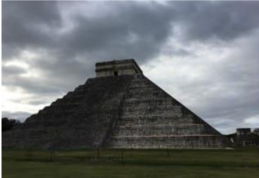
Pirámide de Kukulcán

La Reunión de Adoración Dominical tiene una duración de una hora (11-12hs, hora de la Ciudad de México) y la de Entre Semana (los miércoles), de media hora (19-19:30hs). Seguidas ambas de un tiempo de convivencia.