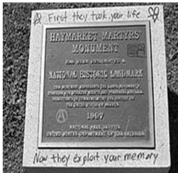
Placa del gobierno de Chicago en el Monumento a los Mártires de Haymarket «Primero tomaron vuestras vidas, ahora explotan vuestra memoria»

El día del trabajo se estableció el 1º. de mayo por el Congreso Obrero Socialista celebrado en París en 1889 con el propósito de reivindicar a los Mártires de Chicago, quienes participaron en una huelga generalizada que paralizó cerca de 12,000 fábricas el 1º. de mayo de 1886. En este movimiento luchaban por un horario laboral de 8 horas diarias, cuando en aquellas fechas las jornadas eran de entre 12 y 16 horas; de esta manera se tendrían ocho horas para el sueño y el mismo tiempo para el hogar y la familia. En Chicago, las condiciones laborales eran peores que en otros lugares, miles de trabajadores que iniciaron esta batalla continuaron movilizaciones y enfrentamientos violentos los días 2 y 3 de mayo. Varios obreros fueron condenados, ejecutados y perseguidos, pero gracias a su lucha lograron beneficios para los trabajadores a nivel mundial. En México se determinó hacer oficial este día en 1923, mientras que en Estados Unidos lo cambiaron al primer lunes de septiembre.