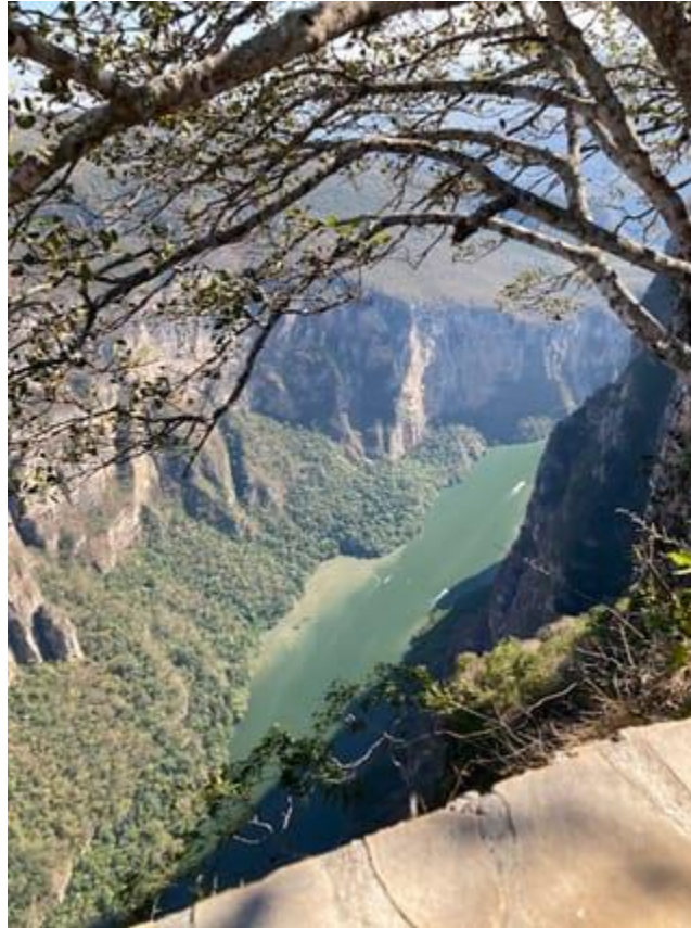
Cañón del Sumidero, Chiapas