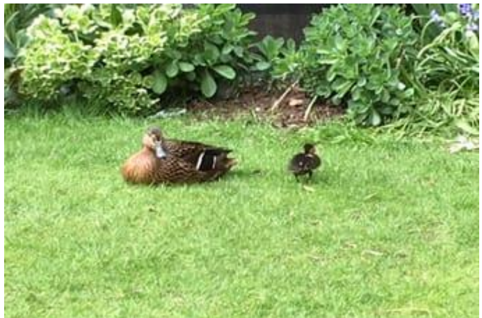
Patos: mamá e hijo

Amor de madre, que no guarda rencor, que no olvida, que daría su alma y su vida sin duda alguna, tan sólo por mí.