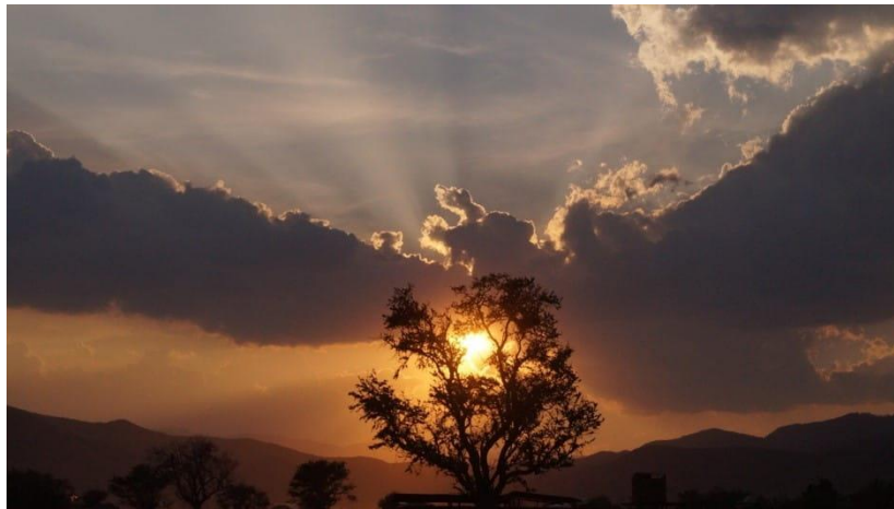
El Guamuchil del Marqués, San Pablo Huixtepec, Oaxaca.