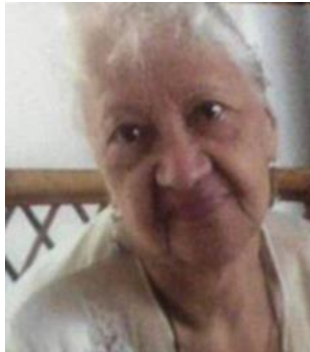
Mi querida mamá

muerte. Desde que conocí el cuaquerismo vivo para celebrar la vida, con la absoluta seguridad de que el Amor Divino, me permite alegrarme y no temer en nada esa circunstancia segura que nos reserva la muerte. Admiro la tradición mexicana de la conmemoración de difuntos, donde marca la vida del pueblo y me llena de esperanza sobre lo que será una transición segura a otro estado del cual prefiero no especular y esperar pacientemente la voluntad divina. Mamá reposa con mi abuela, mi tío y una prima en el panteón de la familia, donde a menos de 30 metros hay una iglesia evangélica, su culto es festivo y cada día que voy están “alabando” con gritos, canciones y equipos de sonido. Me digo, “mamá ¿dónde has venido a reposar? ¡El vecindario es excesivamente alegre! ¡Espero no perturbe mucho tu sueño! ¡Hasta siempre mamá!