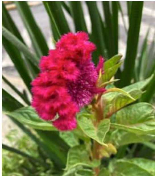
Flor de Día de Muertos

Me gustan mucho las frases poéticas que dicen: “al morir un ser querido, puedes verlo en el firmamento en una estrella nueva” y la de que “somos polvo de estrellas.” Para mí, es una forma bella de recordarles y “sentir” su presencia. Y también, pienso en la transformación, metamorfosis y re-encarnación. Recuerdo la frase del monje de Vietnam, Thich Nhat Hanh: “Una nube nunca muere, sonríele a la nube en tu té.”