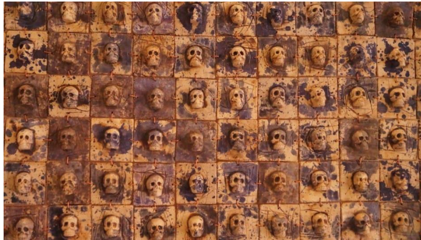
Tzompantli de Omar Hernández

Hoy la UNESCO no solo se enfoca en los objetos creados por el hombre producto de su inventiva; en un sentido más amplio se han hecho esfuerzos para incluir a la naturaleza y el espacio con el que interactuamos, pues el conocimiento viene de todos lados y su preservación es imperativa para la humanidad.