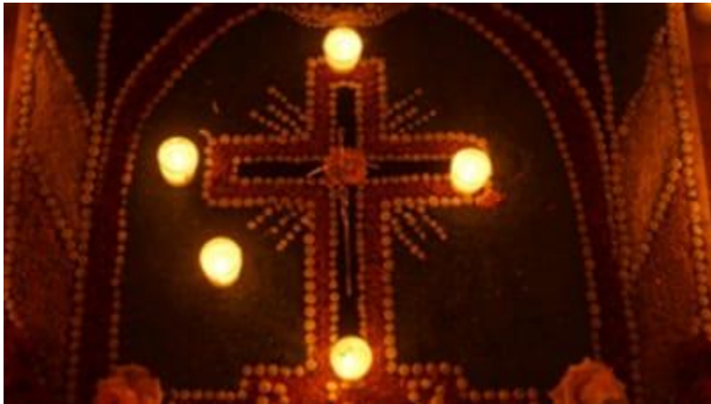
Tapete de flores a mi padre, Oaxaca

En México durante el mes de noviembre se acostumbra celebrar y llevar a cabo las festividades alusivas al día de muertos. Como cada año, en mi casa nos hemos preparado con cañas, manzanas, nísperos, flores, pan y todo lo necesario para adornar la ofrenda que da la bienvenida a nuestros seres queridos. Este año ha sido muy especial para mí, ya que por primera vez ha tocado recordar a todos en un mismo altar: a mi madre, a mis abuelos y a mi padre, quien recientemente ha cumplido 2 años de fallecido. Así que, en la ofrenda he puesto cosas para todos pero con especial atención en mi papá, recordando aquello que más le gustaba: he puesto un litro de leche junto a su fotografía y un pan de yema como los que le gustaban. De manera simbólica he esperado que tome su taza de leche y remoje su pan como solía hacerlo diariamente antes de dormir. Este recuerdo, como muchos otros, aún permanecen frescos en mi mente justo como era la vida antes de la pandemia.