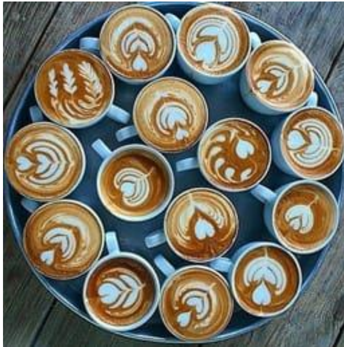
Las diferencias en la unidad