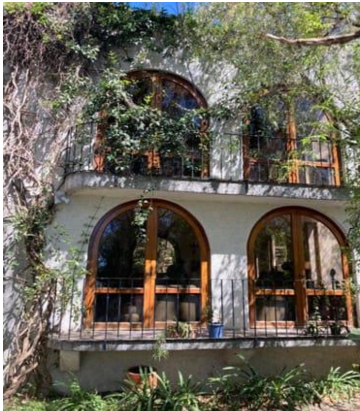
Ventanas con luz, hospitalidad y amistad