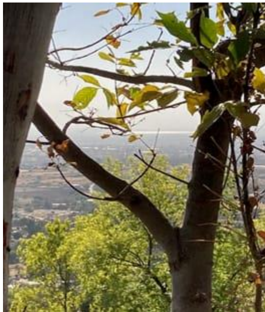
Lago de Texcoco desde La Purificación

En las meditaciones, me dejaba llevar por mis pensamientos como quien está viendo una película, hilando así historias que rayaban en lo surreal y onírico. Trataba siempre, bajo la sospecha de que la Luz tenía algo que decirme, de buscar algún mensaje, aunque fuese sólo entre líneas y, a veces, sólo conseguía ideas bastante abstractas, cuando yo buscaba instrucciones prácticas. En plática privada, una de las Amigas me aconsejaba buscar lo que ella llamaba mi “centro”. No comprendía exactamente cuál era mi centro o cómo llegaba a él, hasta que en la adoración pasada creí comenzar a entenderlo.