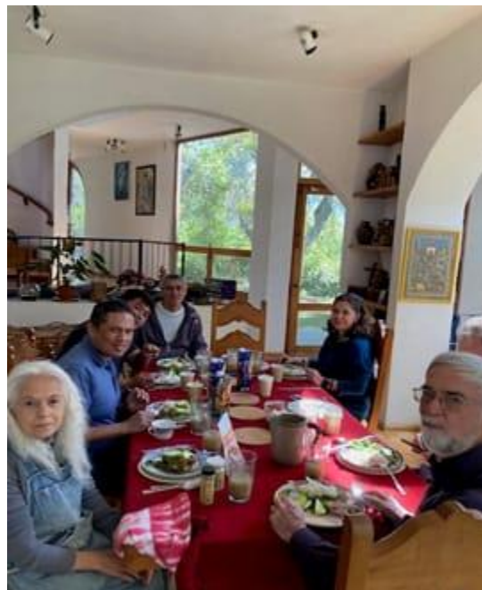
Compartiendo tiempo, espacio y alimentos

El poder vernos y saludarnos en persona fue una experiencia enriquecedora y que es difícil de explicar con palabras. Varios o casi todos los asistentes coincidimos en que vernos en pantalla es como vernos en solo dos dimensiones y que en persona es apreciarnos en más dimensiones. Es decir, hay una sensación de “calor humano”, de cohesión al sentir los movimientos de los demás, como el inhalar y exhalar, ver las sonrisas, las expresiones de los ojos. Es como una “oleada de estímulos” que nos permite, en verdad, ver “aquello de Dios en cada uno” y palpar todo lo que nos une como comunidad. Todos agradecemos a los anfitriones por su gran hospitalidad.