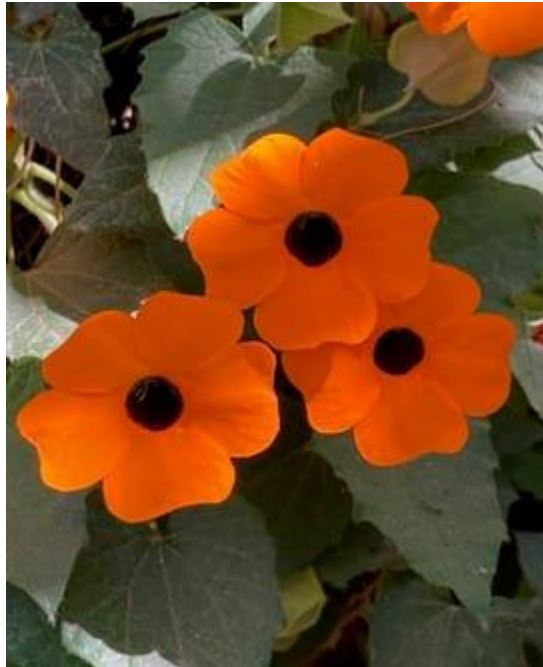
Flores en La Purificación, Texcoco