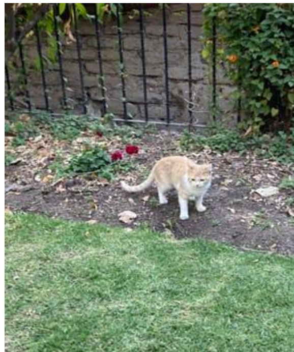
La libertad del gatito Jengibre en La Purificación

La libertad, Sancho, es uno de los más preciosos dones que a los hombres dieron los cielos; con ella no pueden igualarse los tesoros que encierra la tierra ni el mar encubre; por la libertad, así como por la honra se puede y debe aventurar la vida, y por el contrario, el cautiverio es el mayor mal que puede venir a los hombres. Digo esto, Sancho, porque bien has visto el regalo, la abundancia que en este castillo que dejamos hemos tenido; pues en mitad de aquellos banquetes sazonados y de aquellas bebidas de nieve, me parecía a mí que estaba metido entre las estrecheces del hambre, porque no lo gozaba con la libertad que lo gozara si fueran míos, que las obligaciones de las recompensas de los beneficios y de las mercedes recibidas son ataduras que no dejan campear el ánimo libre. ¡Venturoso aquél a quien el cielo dio un pedazo de pan sin que le quede obligación de agradecerlo a otro que el mismo cielo!