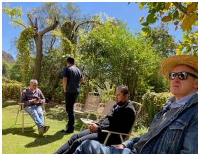
Disfrutando el jardín en el retiro

Asistimos 11 personas y se hizo hincapié en que dada la incertidumbre sobre la situación Covid-19, se usara máscaras cuando estuviéramos en grupo dentro de la casa. Se hicieron varias reuniones en el jardín cuando fue posible. En caso de tener tos o fiebre u otros posibles indicios de infección, se solicitó no unirse al retiro por el bien de todos.