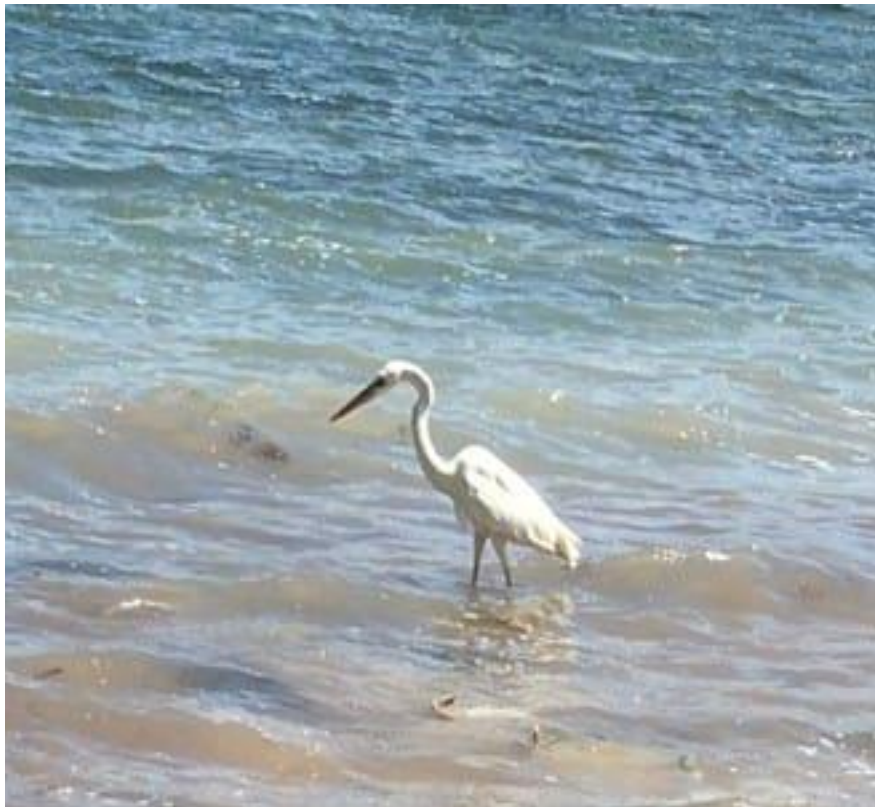
La paciente espera

4. Dudas. - se invitan preguntas, dudas, inquietudes y asuntos relacionados con la Junta Mensual o la Sociedad Religiosa de los Amigos, enviando un correo a juntamensual@gmail.com