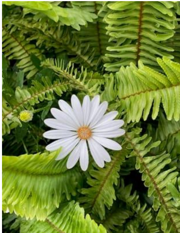
Margarita y su botón entre los helechos