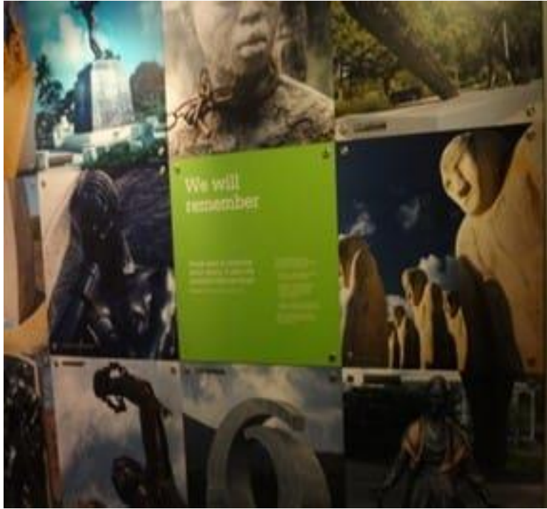
We will remember (Recordaremos), Museo Internacional de la Esclavitud, Liverpool, Reino Unido