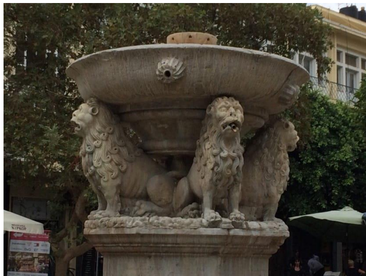
Las historias o relatos pueden romper la dignidad pero también repararla

Desde hace varios años la Junta Anual del Pacífico ha promovido la formación del grupo de interés de los Amigos de Color (Friends of color) y ha organizado retiros donde se exploran temas de discriminación, principalmente en los Estados Unidos y en los grupos cuáqueros. Algunos Amigos continúan reuniéndose vía Zoom y han revisado recursos como: el libro The Wretched of the Earth por el filósofo Franz Fanon en el cual brinda un psicoanálisis de los efectos deshumanizantes de la colonización en el individuo y la nación, y discute las implicaciones más amplias sociales, culturales y políticas de establecer un movimiento social de descolonización de una persona y de la gente. Otro recurso recomendado es el artículo por Tuck y Yang Decolonization is not a metaphor - Center for Latin American Studies . Finalmente, consideran relevante y muy útil la producción de la escritora de Nigeria Chimamanda Adichie, la cual expresa en la plática TED El peligro de una sola historia y que nuestras vidas y culturas se componen de muchas historias superpuestas. Ella cuenta la historia de cómo encontró su auténtica voz cultural y advierte que si escuchamos una sola historia sobre otra persona o país, corremos el riesgo de un malentendido crítico ( https://www.ted.com/talks/chimamanda_ngozi_adichie_the_danger_of_a_single_story?language=en ).