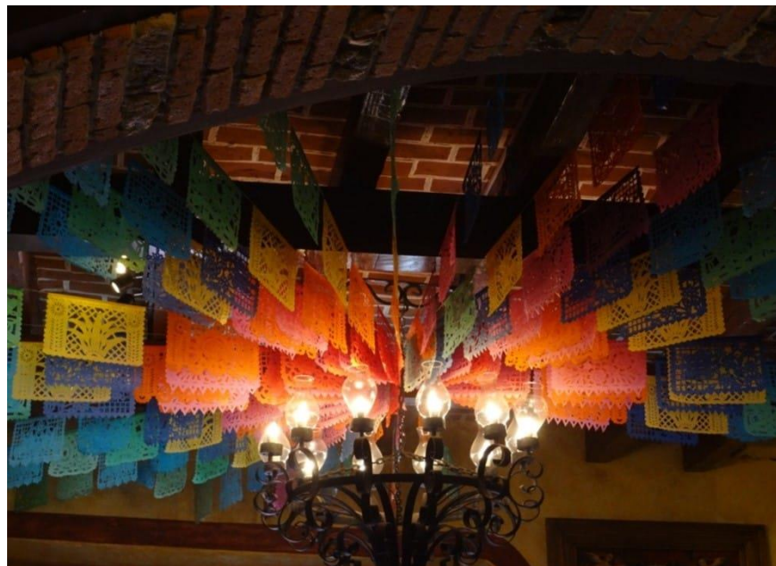
Luz, color y alegría festiva

Ellas, yacen en su interior... Nosotros solo pedimos una plegaria, para que encuentren la Luz... Ellas y nosotros agradecemos por las provisiones, ellas se multiplican para ayudar, en silencio, gota a gota de amor ... Ellas, no piden una plegaria, un silencio, una oración y una sonrisa pervivirá en su esperanza. ¿Puedes regalarles una ?