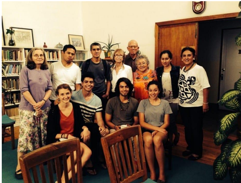
Comunidad de la Junta Mensual y Casa de los Amigos, Ciudad de México, marzo 2014

4. Dudas. - se invitan preguntas, dudas, inquietudes y asuntos relacionados con la Junta Mensual o la Sociedad Religiosa de los Amigos, enviando un correo a juntamensual@gmail.com